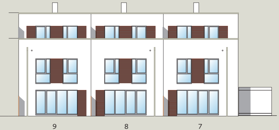
Beispiel Reihenhäuser Nr.