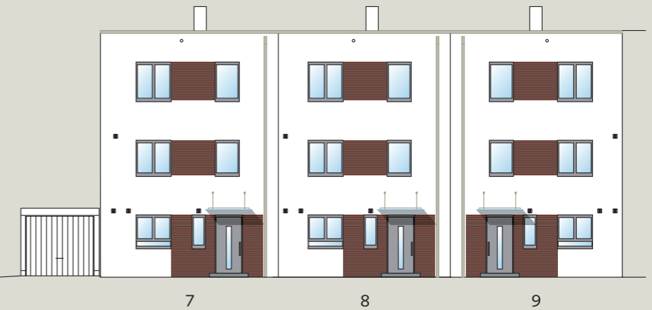
Beispiel Reihenhäuser Nr.