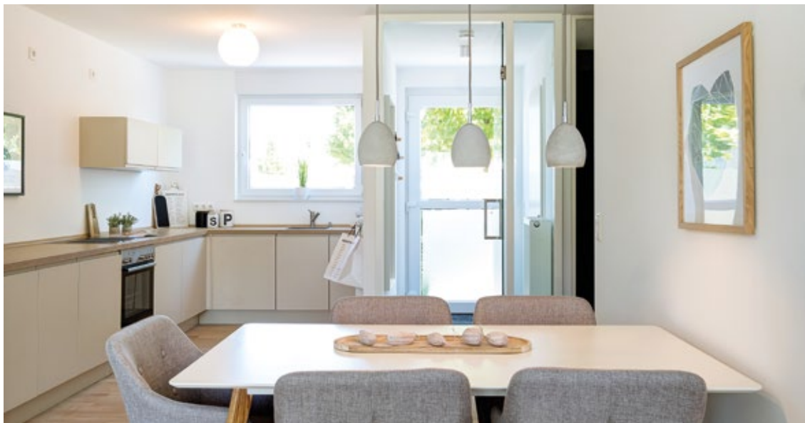
Großzügig und offen: Die offene Küche lädt zum Kochen und Wohlfühlen ein.