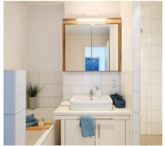
Schön und detailreich: das Bad.