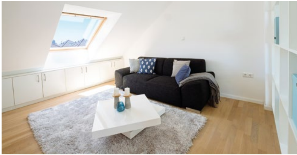
Großzügig und offen: das Dachstudio bietet Raum für individuelle Entfaltung.