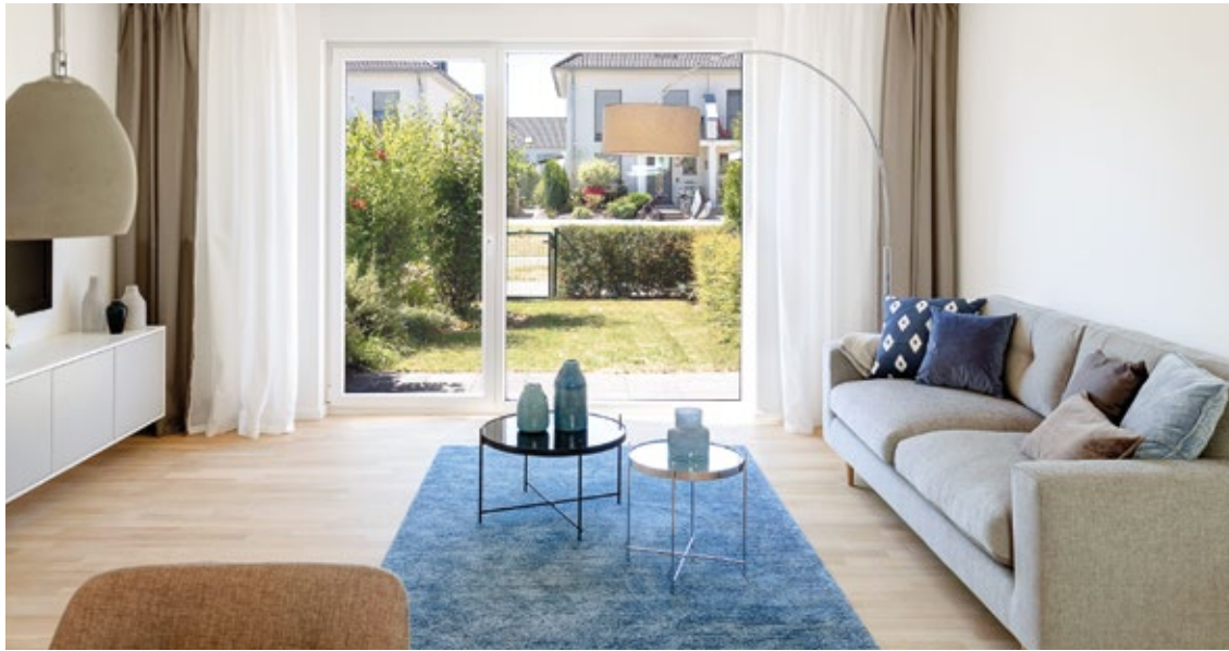
Hell und freundlich: Bodentiefe Fenster im Wohnzimmer sorgen für viel Licht.