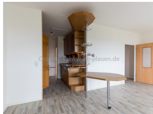
WZ mit offener Küche