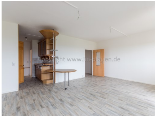
WZ mit offener Küche