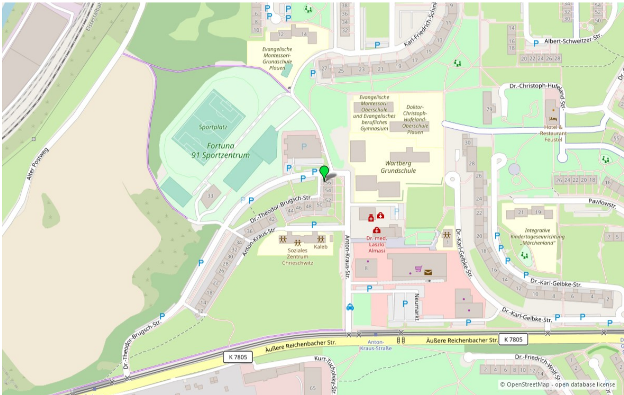
Umgebungskarte für „Dr.-Theodor-Brugsch-Straße 56 in 08529 Plauen“