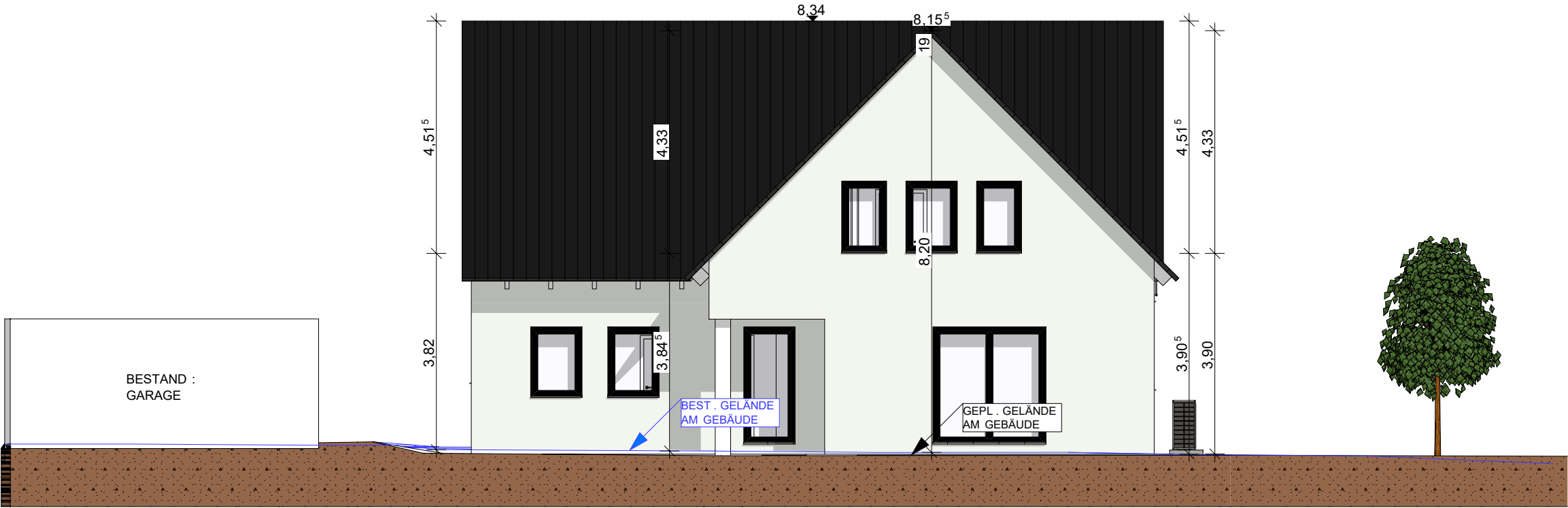
A-04 Ansicht WEST 1:100