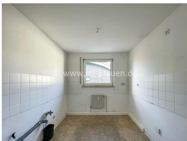
Küche mit Fenster