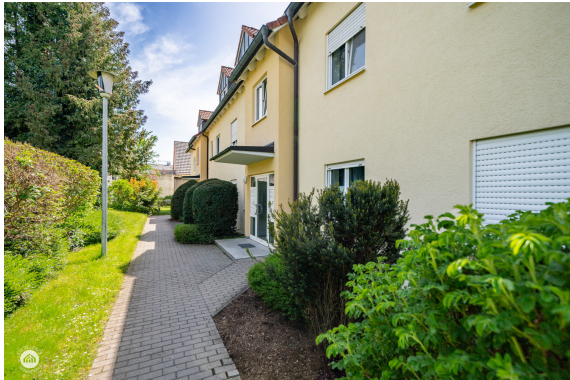
Gebäude - Eingang