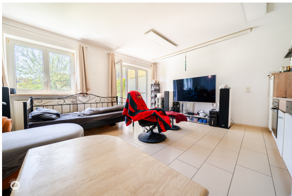
Wohnzimmer - Richtung Terrasse