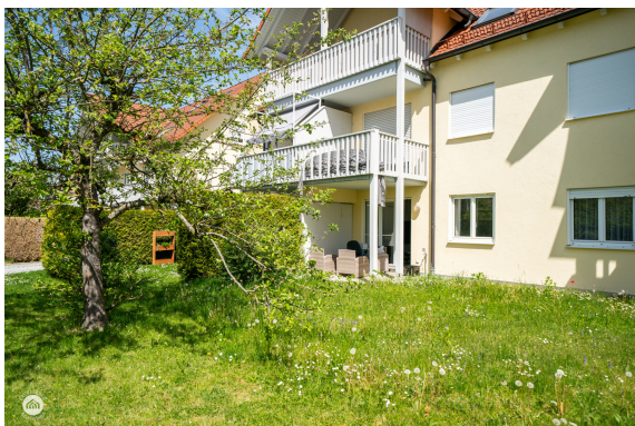
Terrasse mit Baum