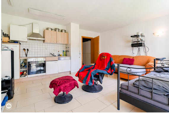
Wohnzimmer - Richtung Küche