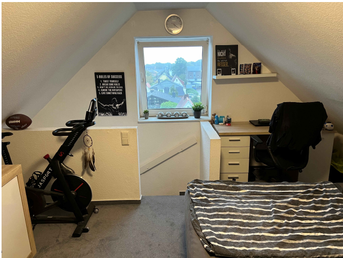
wohnlich ausgebautem Dachboden