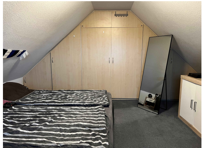
wohnlich ausgebautem Dachboden