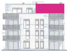
Haus 16 - Ansicht Süd