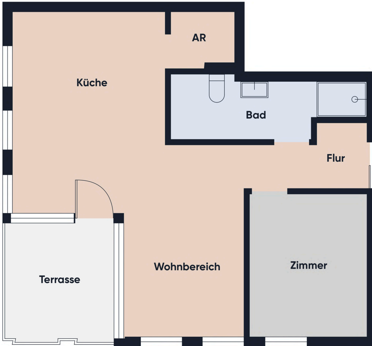
Grundrissplan ohne Maßstab