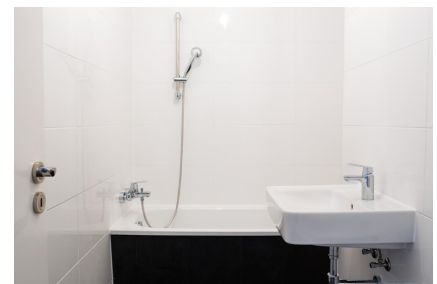
Bad - Beispielbild