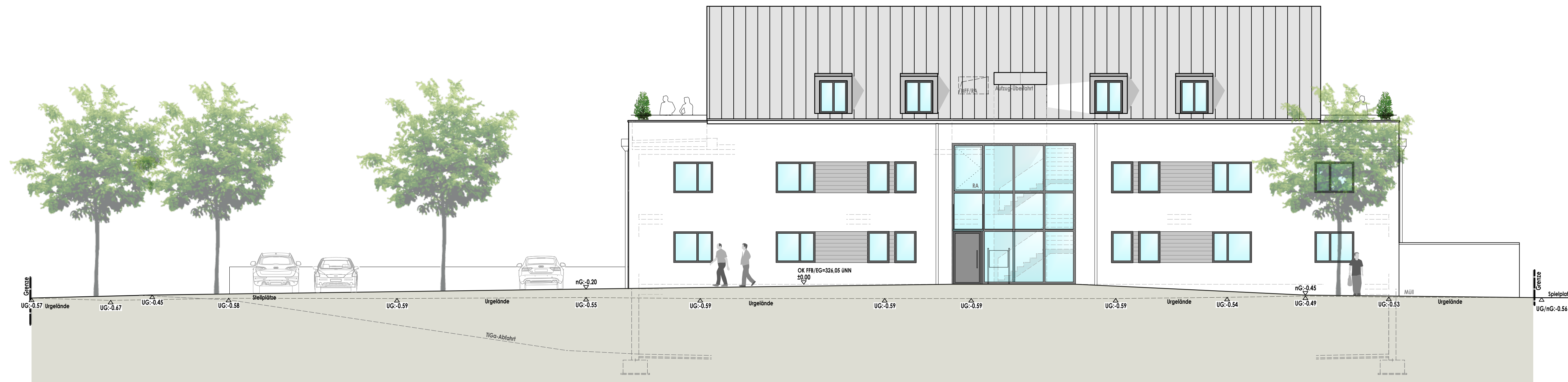
Ansicht von Norden