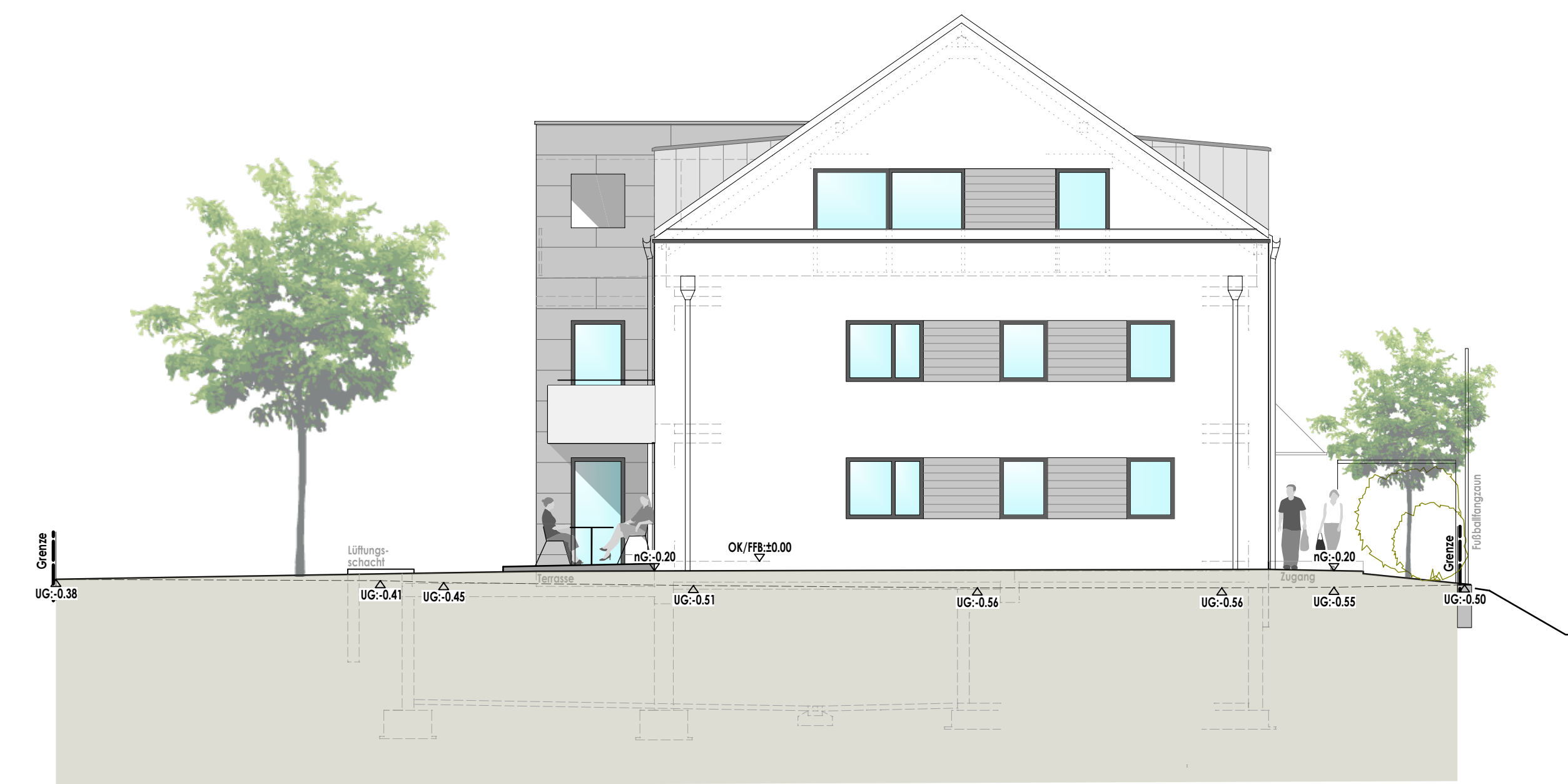
Ansicht von Osten

neubau eines mehrfamilienwohnhauses (11WE) mit Tiefgarage