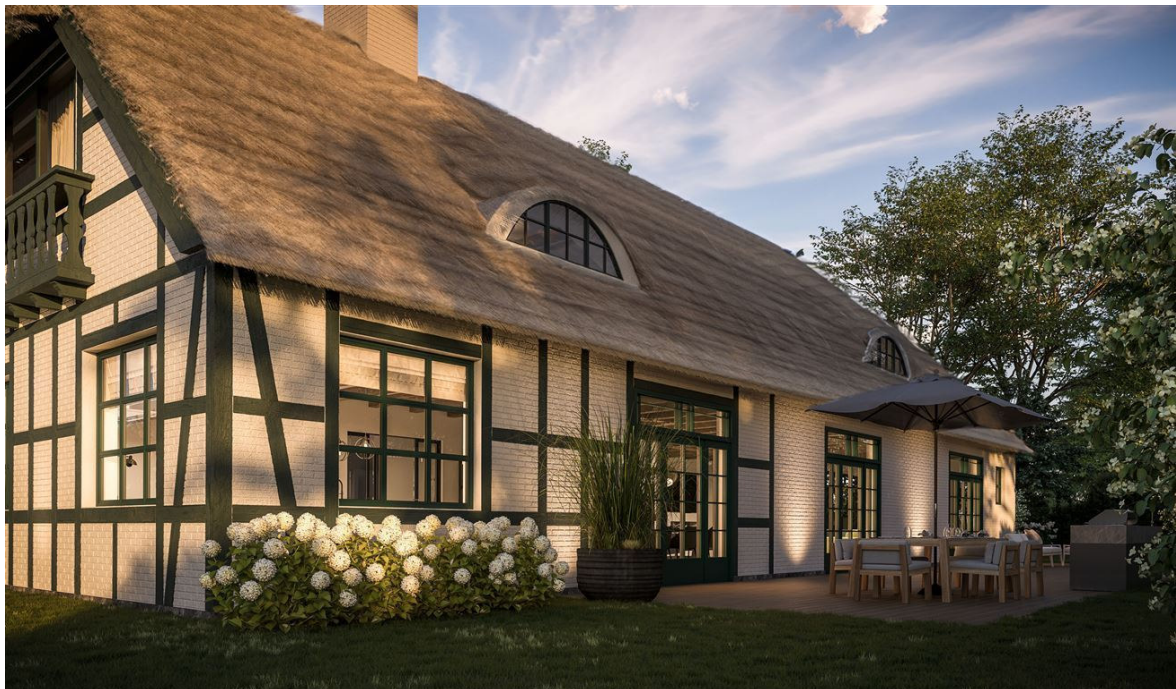
Lauenbrücker Straße 7, 27389 Fintel