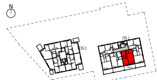
Übersicht 2. Obergeschoss M=1 : 1250