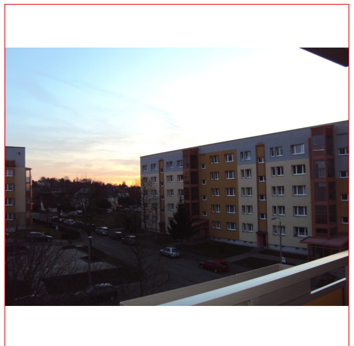
Blick vom Balkon