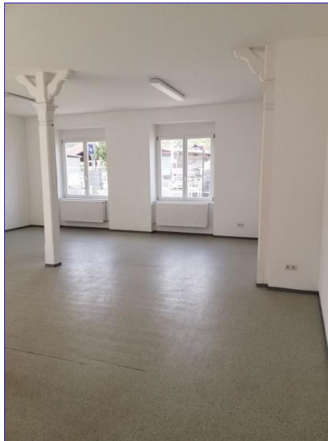
Lager EG 01