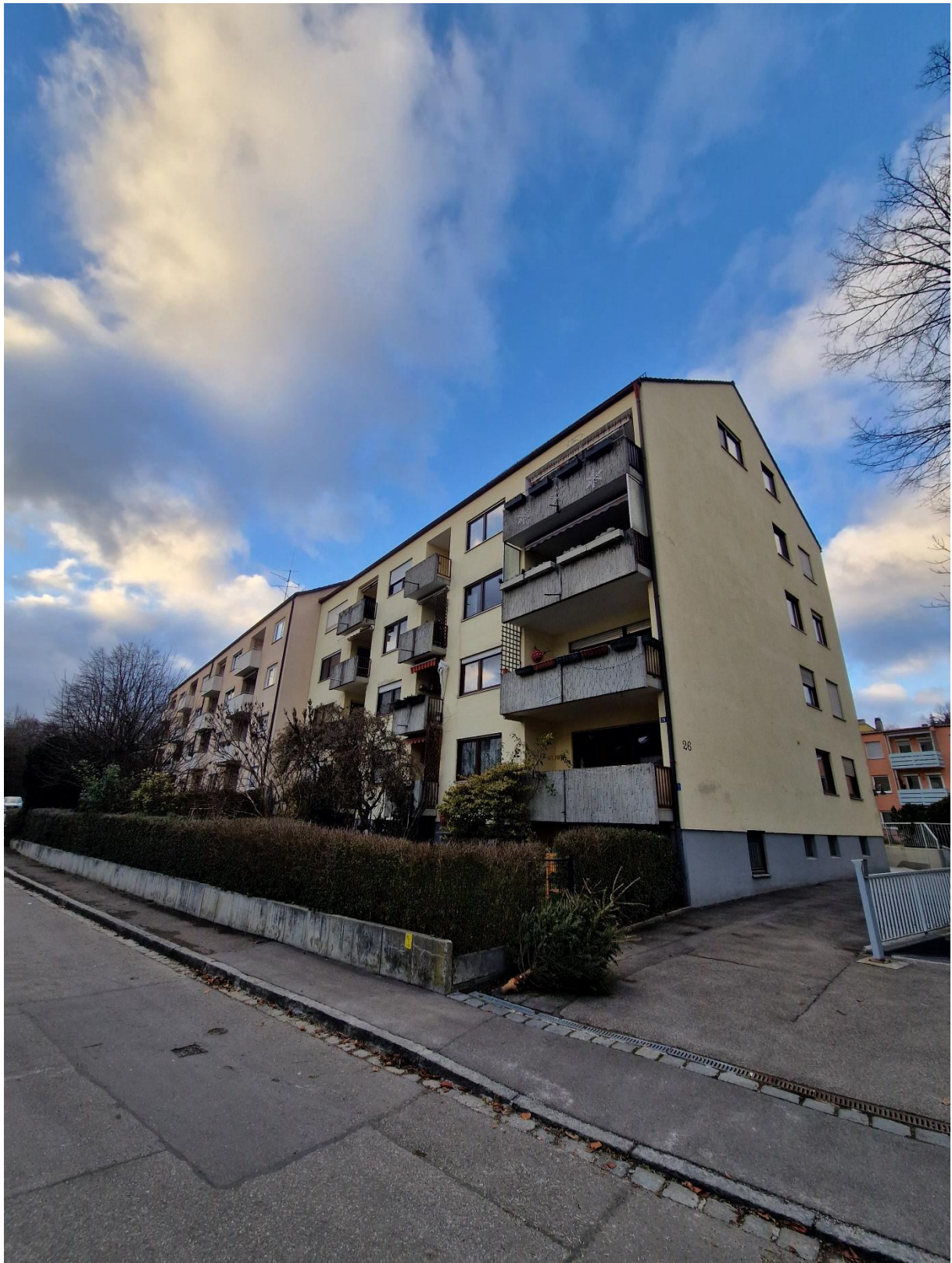
Abbildung 16: Straßenansicht