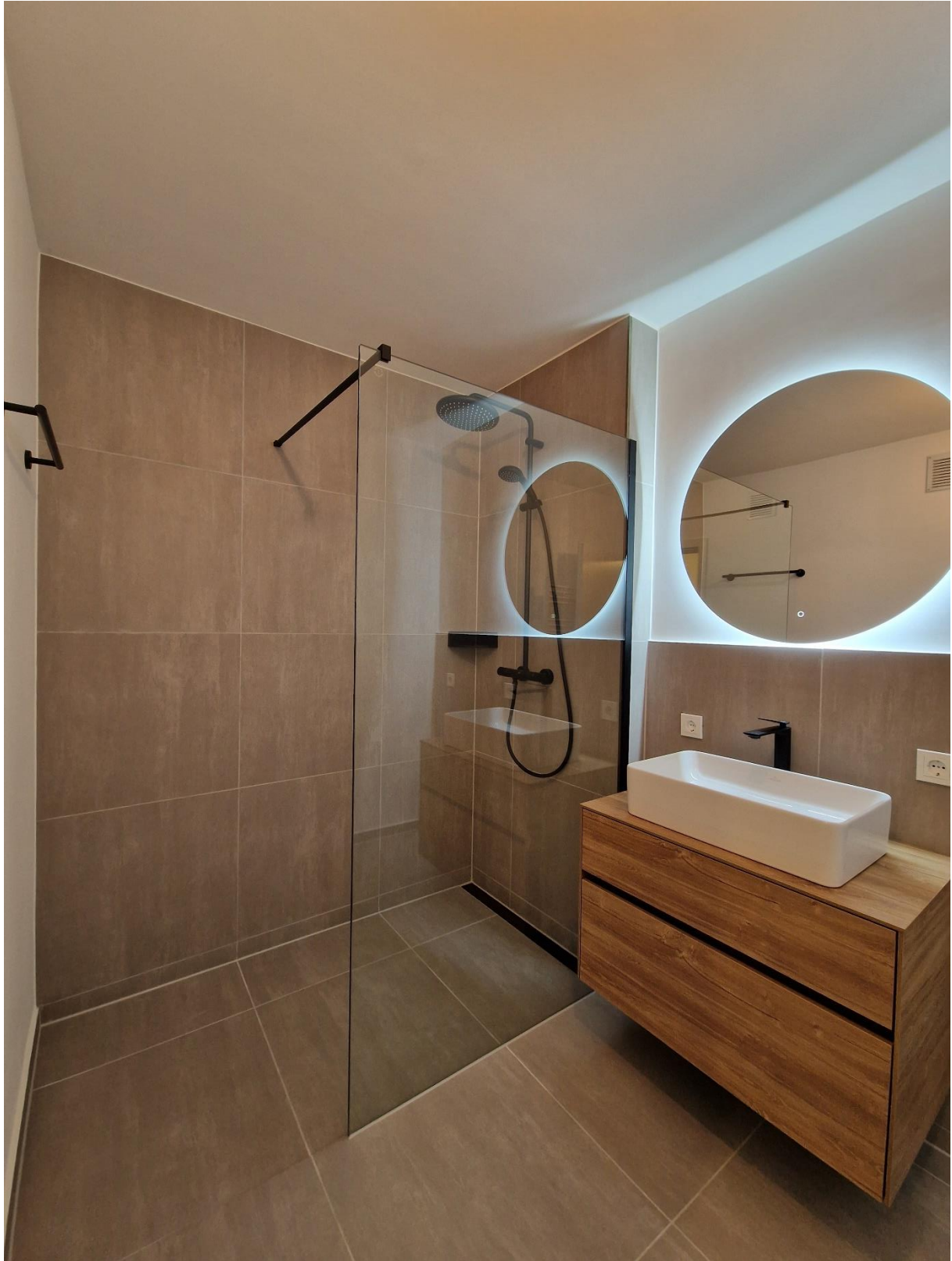
Abbildung 3: Bad