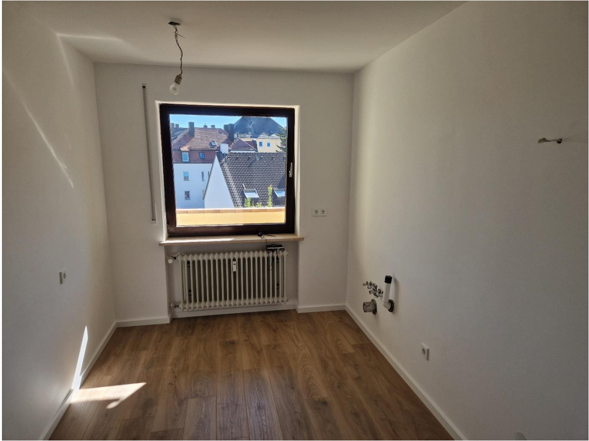
Abbildung 11: Küche