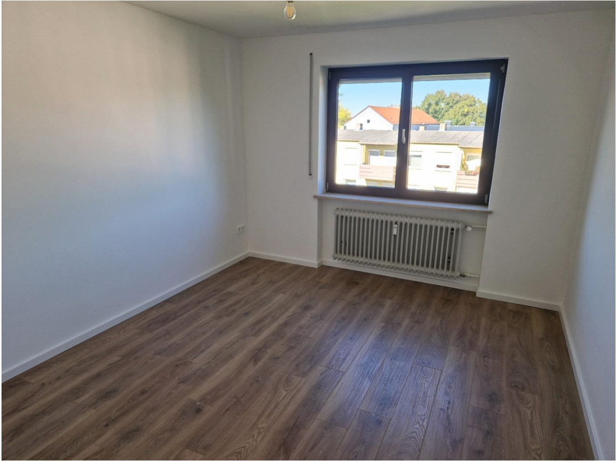
Abbildung 6: Schlafzimmer