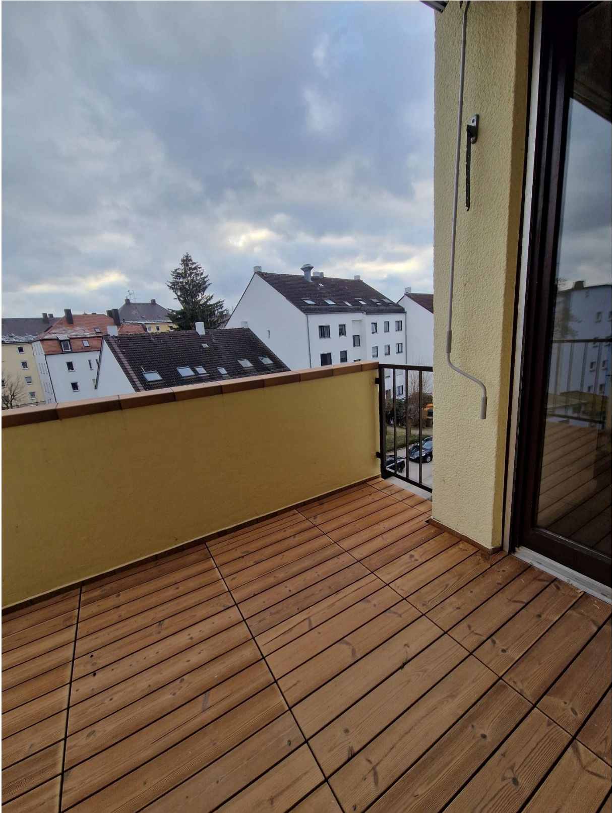
Abbildung 13: Südbalkon