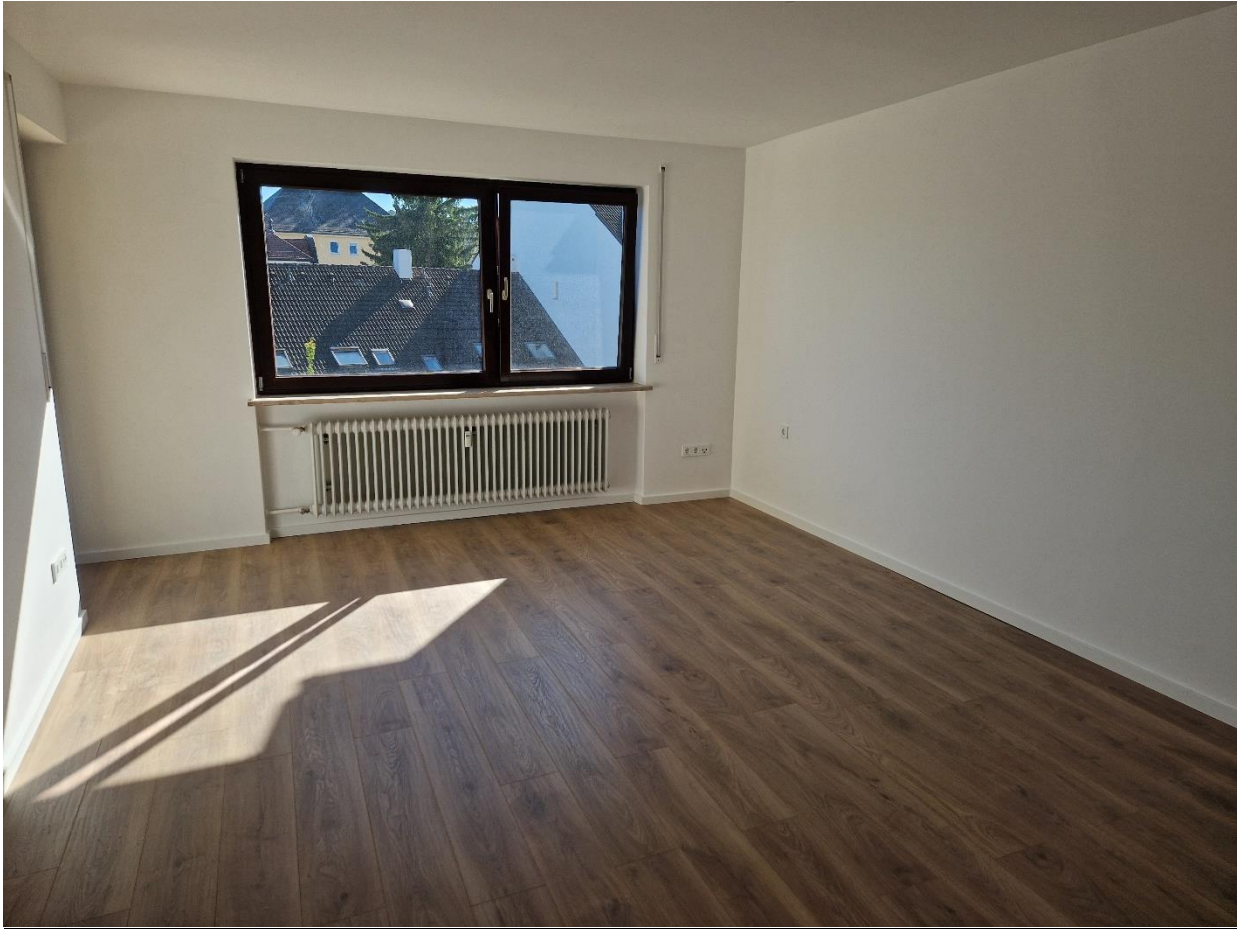
Abbildung 2: Wohnzimmer