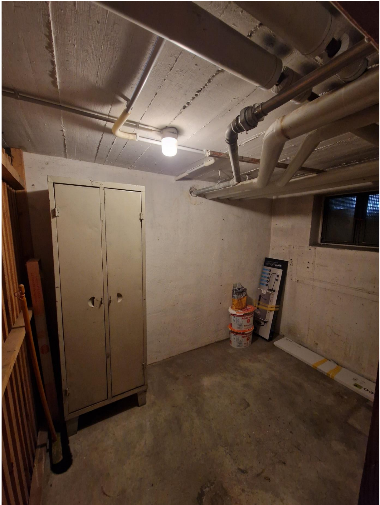
Abbildung 14: Kellerabteil