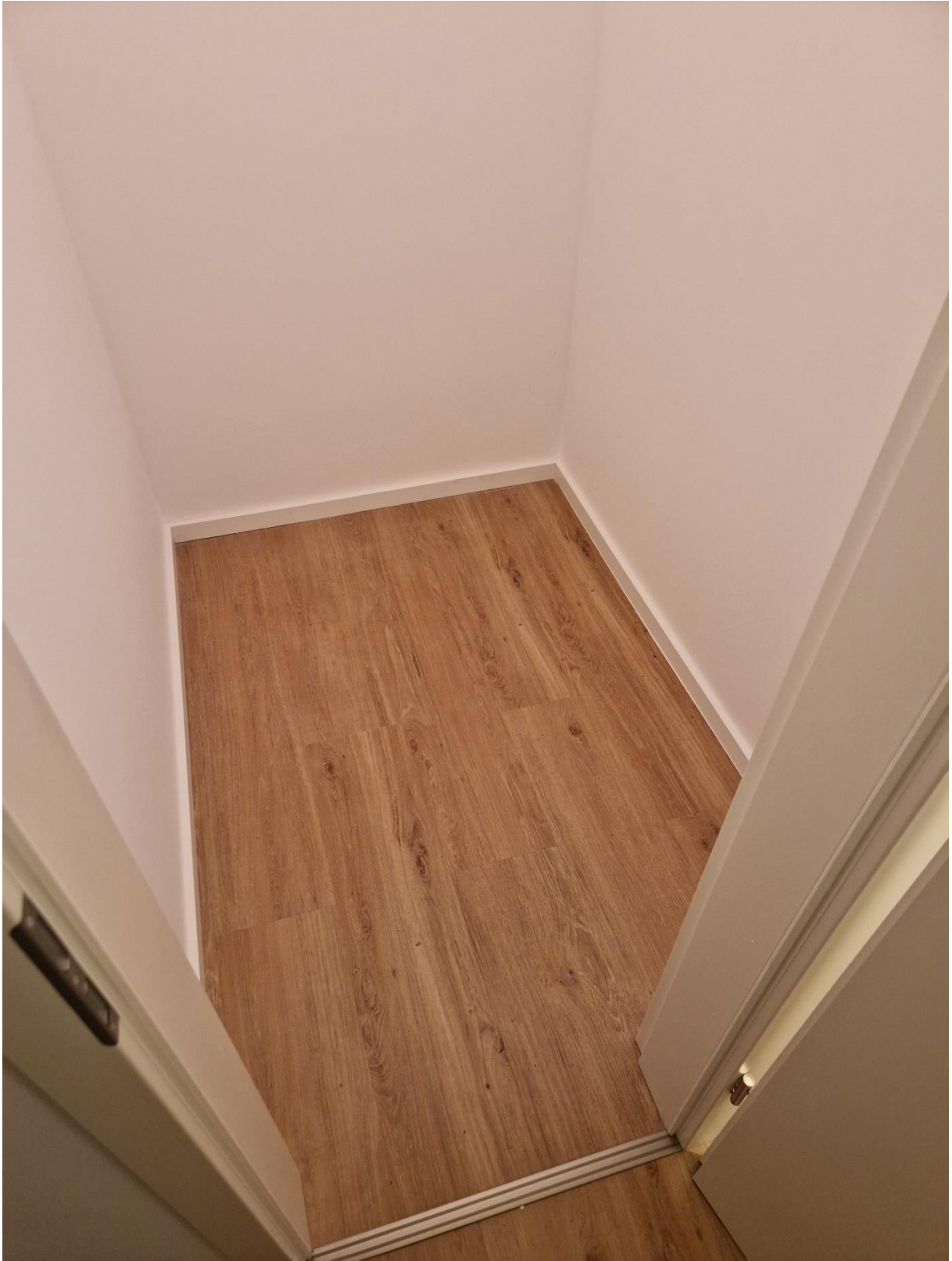
Abbildung 9: Lagerraum