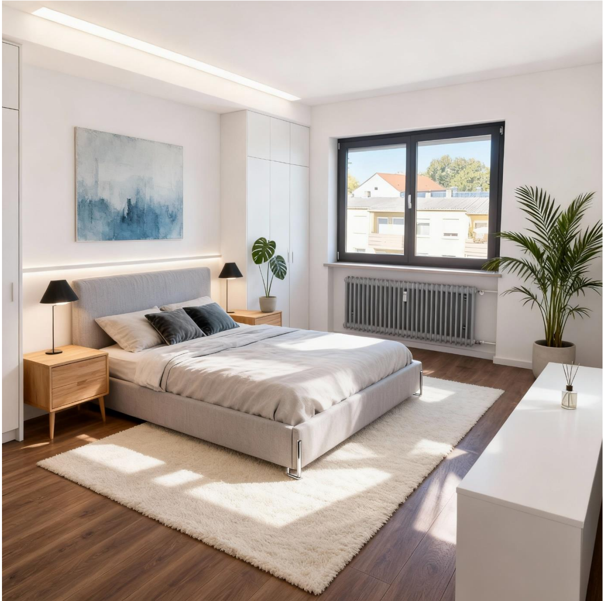
Abbildung 7: Schlafzimmer KI-Staged