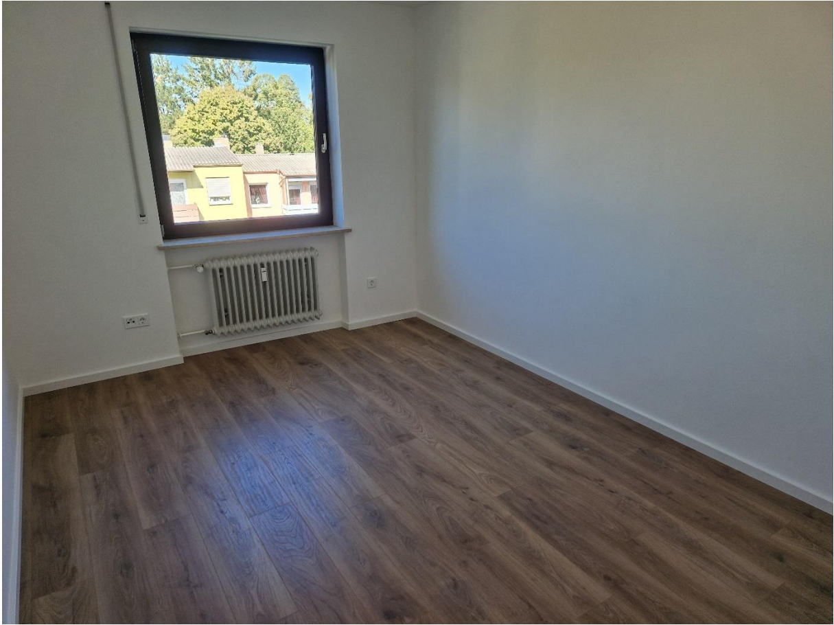
Abbildung 8: Kinder- oder Arbeitszimmer