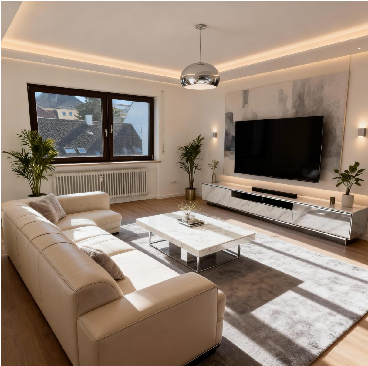
Abbildung 1: Wohnzimmer KI-Staged

Pfersee-Nord, Pater-Roth-Str.26, 86157 Augsburg