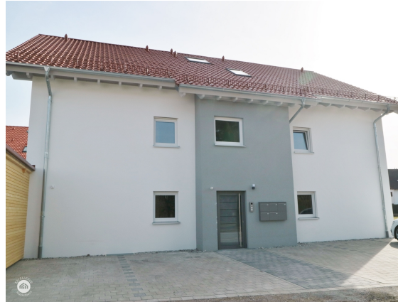
Eingang und Stellplätze