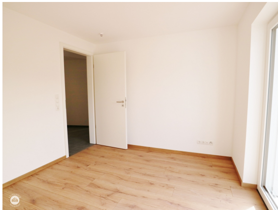
Gast - Homeoffice