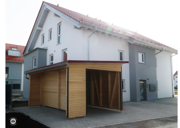
Anlage zum Eingang