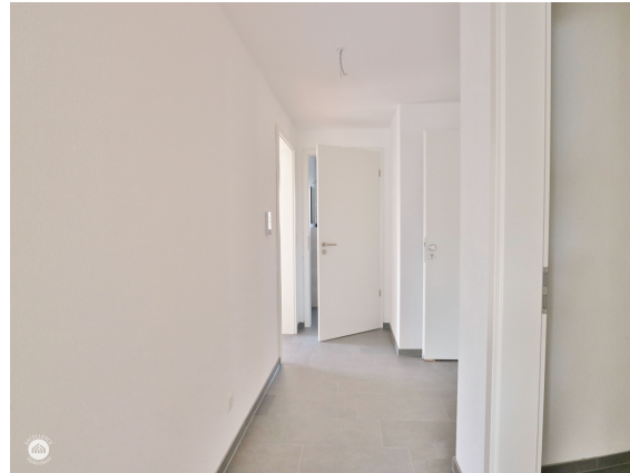
Diele zu Bad und Eingang OG