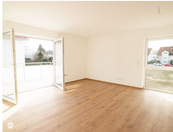
Wohn- Essbereich mit Balkonzugang