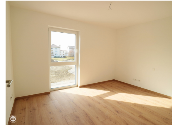
Gast - Homeoffice