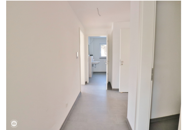
Diele zum Bad