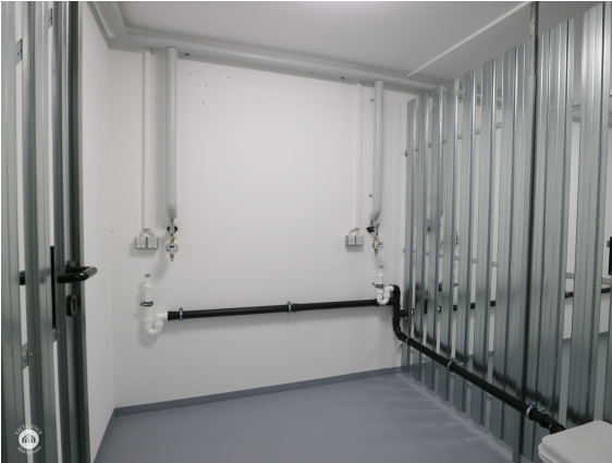
Waschmaschinenanschluss im Untergeschoss