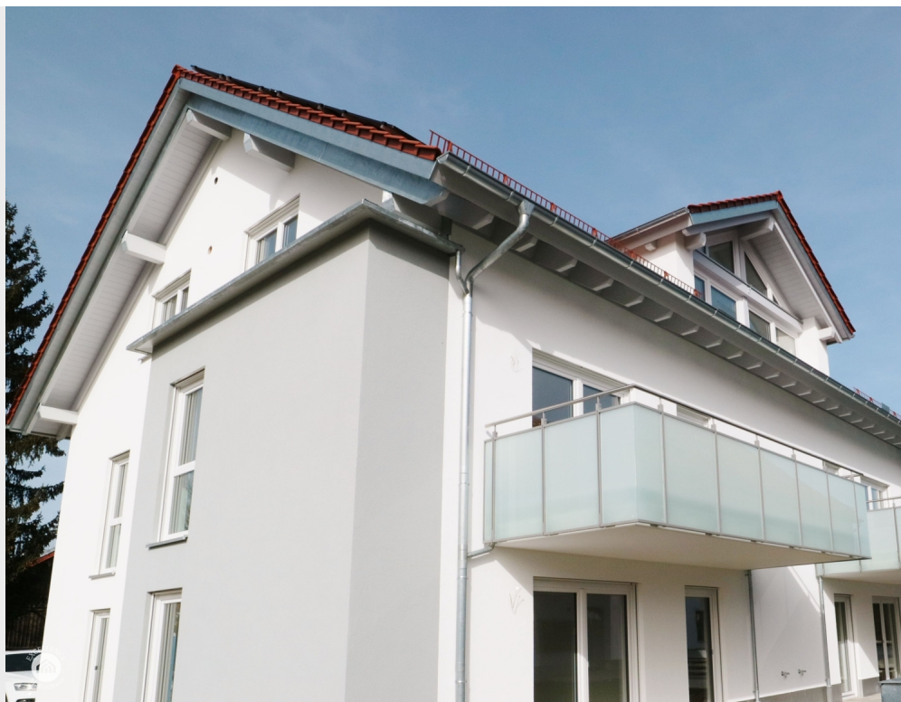
87740 Buxheim, Deutschland