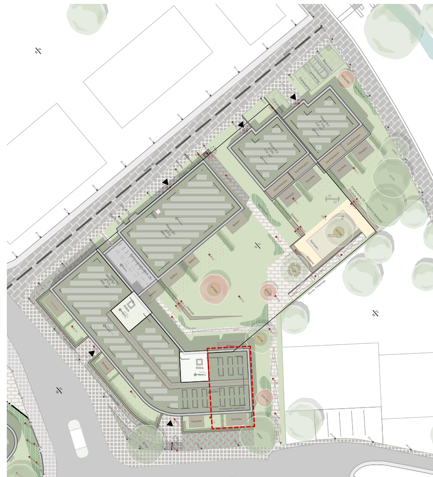
Dr.-Walter-Lübcke Straße > Lage der Wohnung