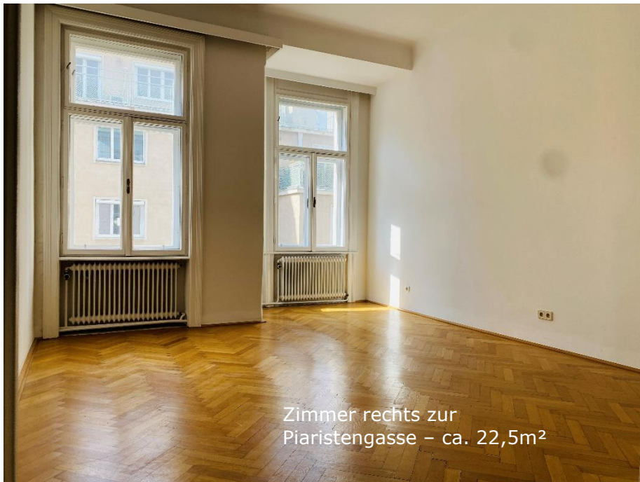
Zimmer rechts zur Piaristengasse – ca. 22,5m 2

Fläche: 104,00m 2 Zimmer: 3 Bad/WC: 1/1 Stock: 3 Bauart: Altbau Lift: ja Garage: nein