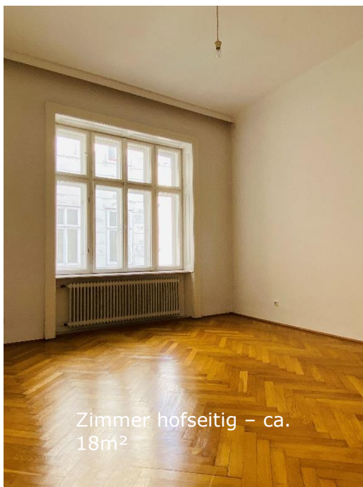
Zimmer hofseitig - ca. 18m 2