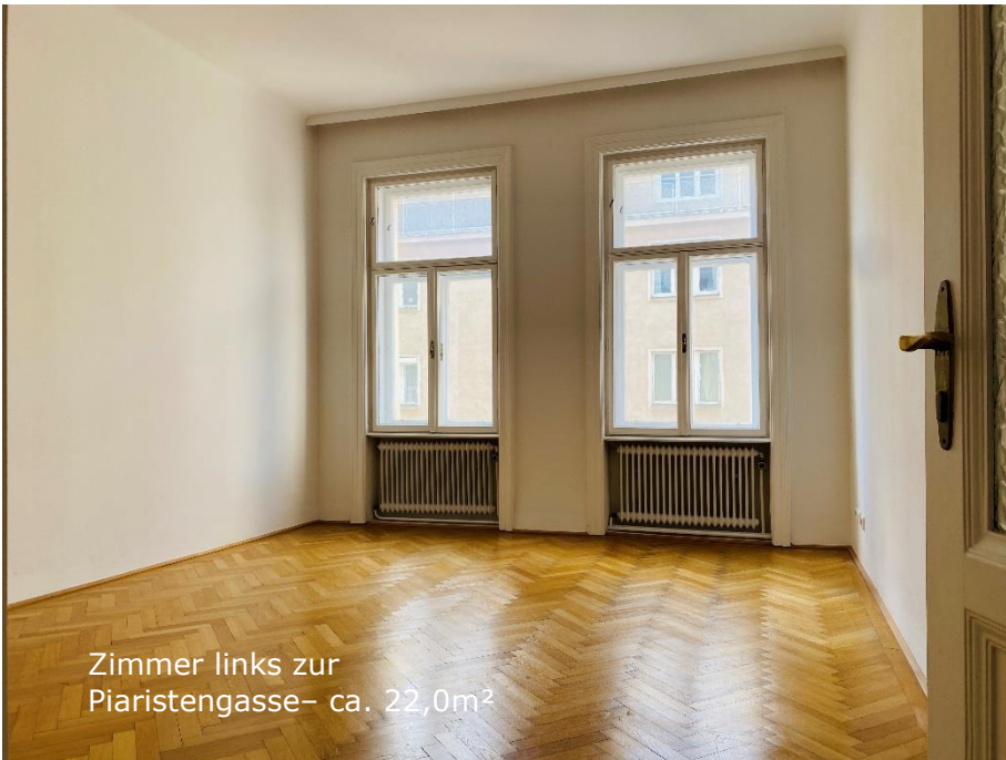
Zimmer links zur Piaristengasse- ca. 22,0m 2