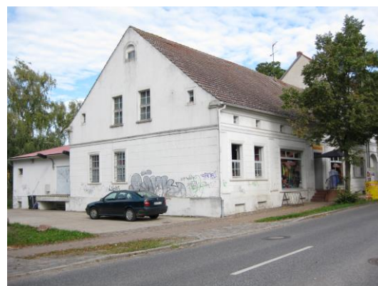
Giebelfassade zum Burgweg