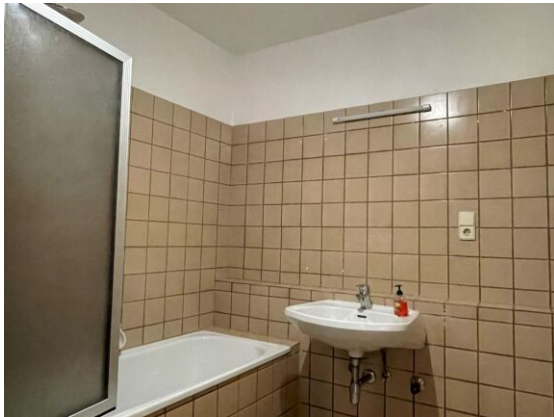
Badezimmer mit Wanne