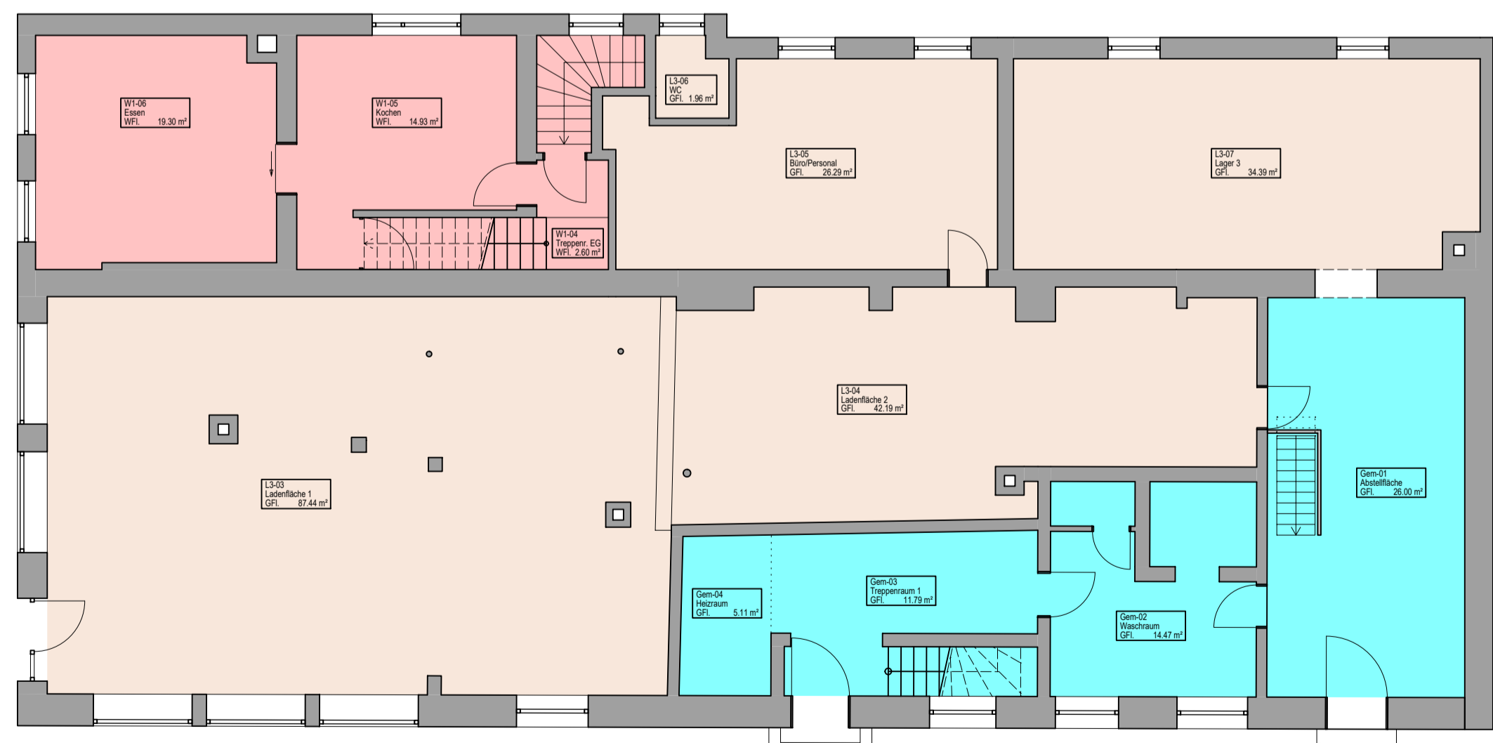
Grundriss EG M 1:100