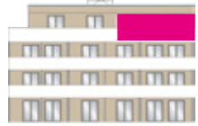
Haus I - Ansicht Ost