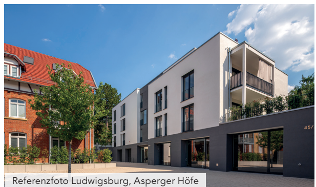
Referenzfoto Ludwigsburg, Asperger Höfe