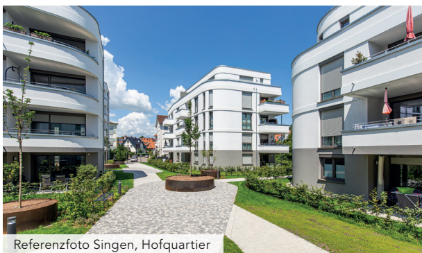
Referenzfoto Singen, Hofquartier

Sie finden unsere Büroräume in der Nähe der Bodensee-Therme und dem Bauamt, in Sichtweite des Sees. Alle unsere Projekte in der Region Bodensee werden von Überlingen aus gesteuert – von der Grundstücksakquise über die Entwicklung, Planung und den Bau des Projektes sowie der Kundenbetreuung.