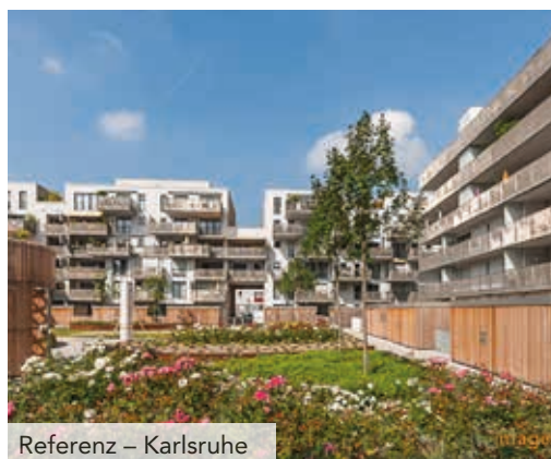
Referenz – Karlsruhe