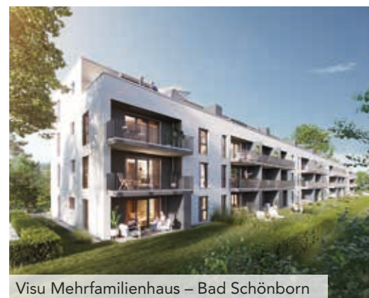
Visu Mehrfamilienhaus – Bad Schönborn