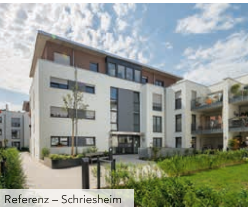
Referenz – Schriesheim

Die BPD Immobilienentwicklung GmbH ist ein unabhängiger Immobilienentwickler mit europäischem Hintergrund. Sie ist ein Unternehmen der niederländischen Rabobank.