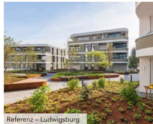
Referenz – Ludwigsburg