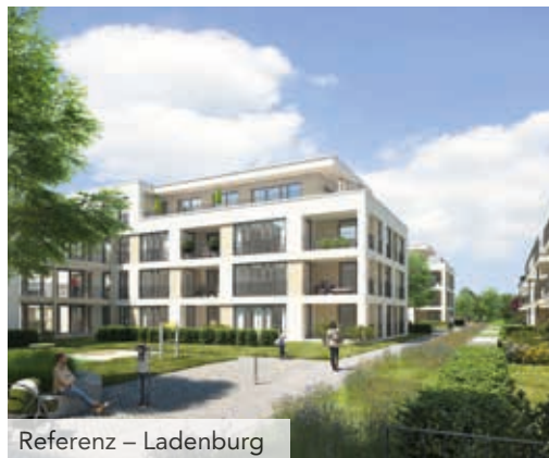
Referenz – Ladenburg