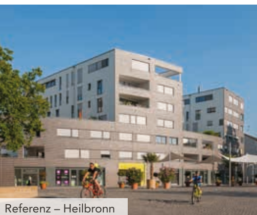
Referenz – Heilbronn