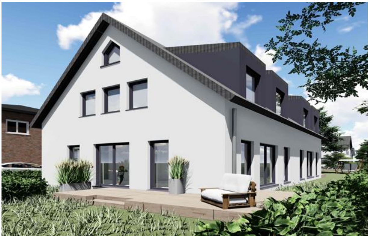
Außenansicht vom Doppelhaus

Zwischen dem Golfplatz Treudenberg und dem Naturschutzgebiet Raakmoor entstehen auf einem Grundstück in einem reinen Siedlungsgebiet ein exklusives Doppelhaus in Massiver Bauweise Stein auf Stein