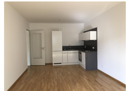
Wohnbereich mit EBK