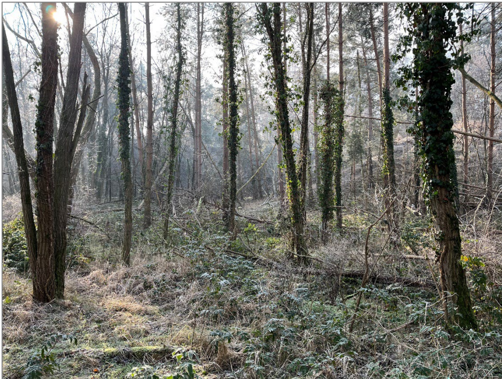
Ansicht auf das Verkaufsgrundstück