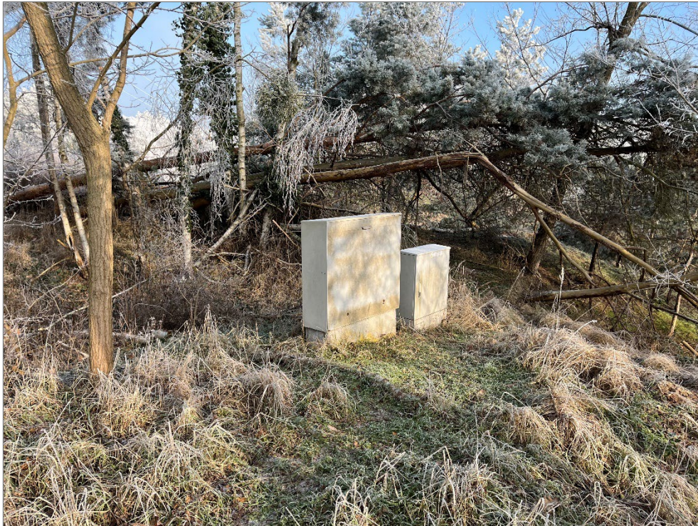
Stromkästen auf dem Verkaufsgrundstück