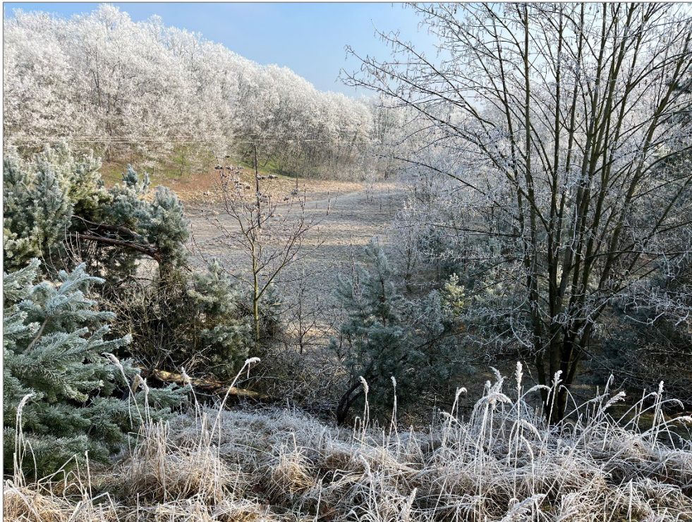
Ansicht auf das Verkaufsgrundstück