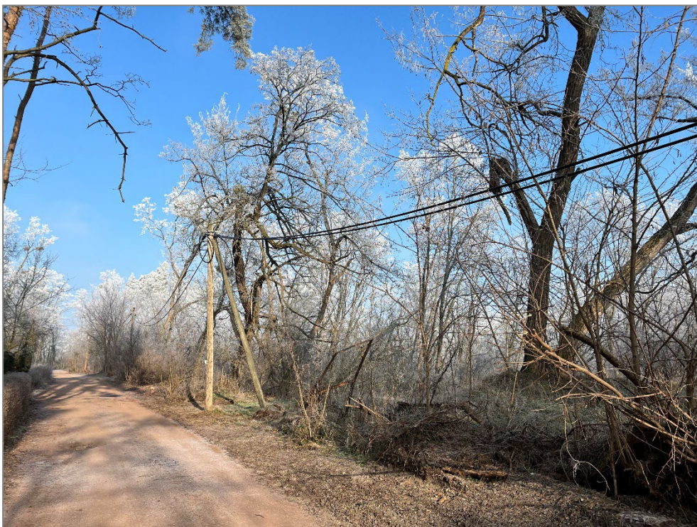
Stromleitungen auf dem Verkaufsgrundstück