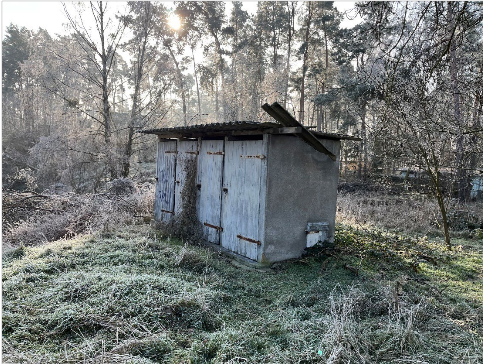
Bebauung auf dem Verkaufsgrundstück