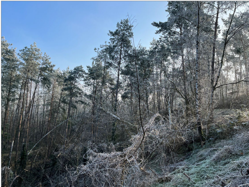
Ansicht auf das Verkaufsgrundstück