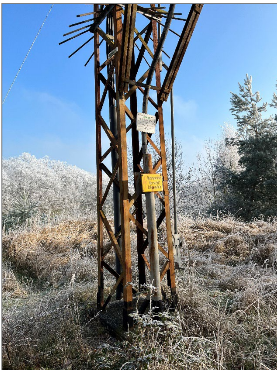
Strommast auf dem Verkaufsgrundstück