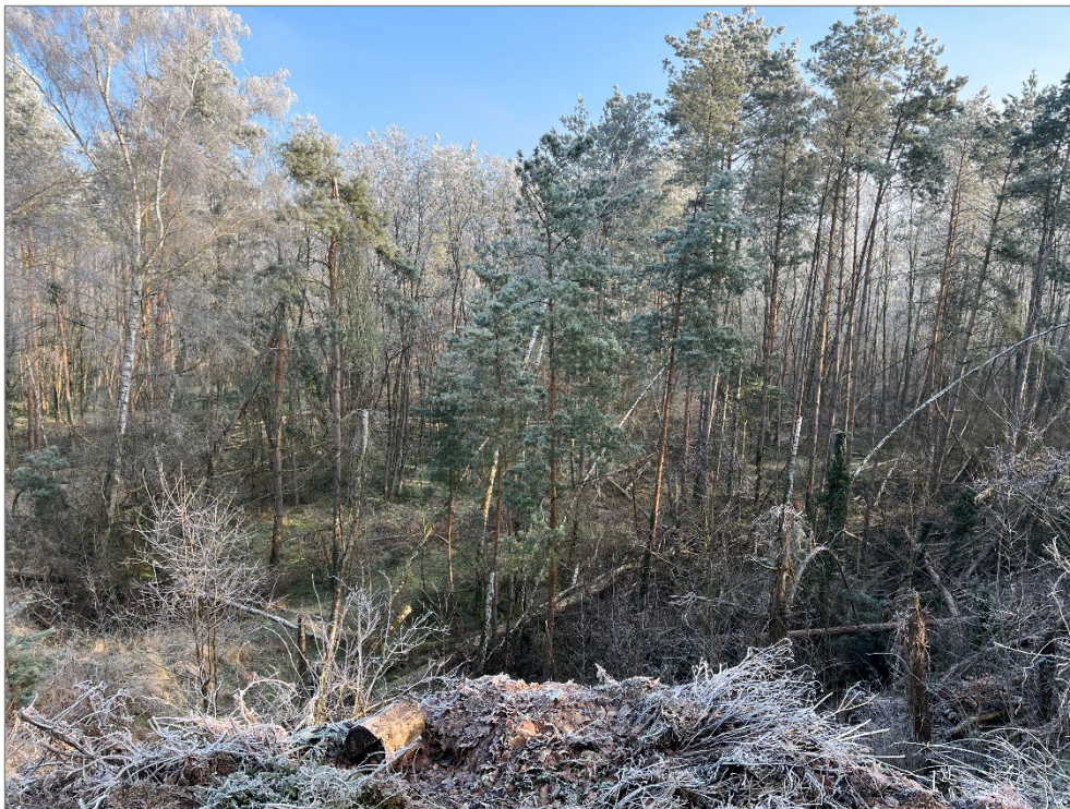
Ansicht auf das Verkaufsgrundstück