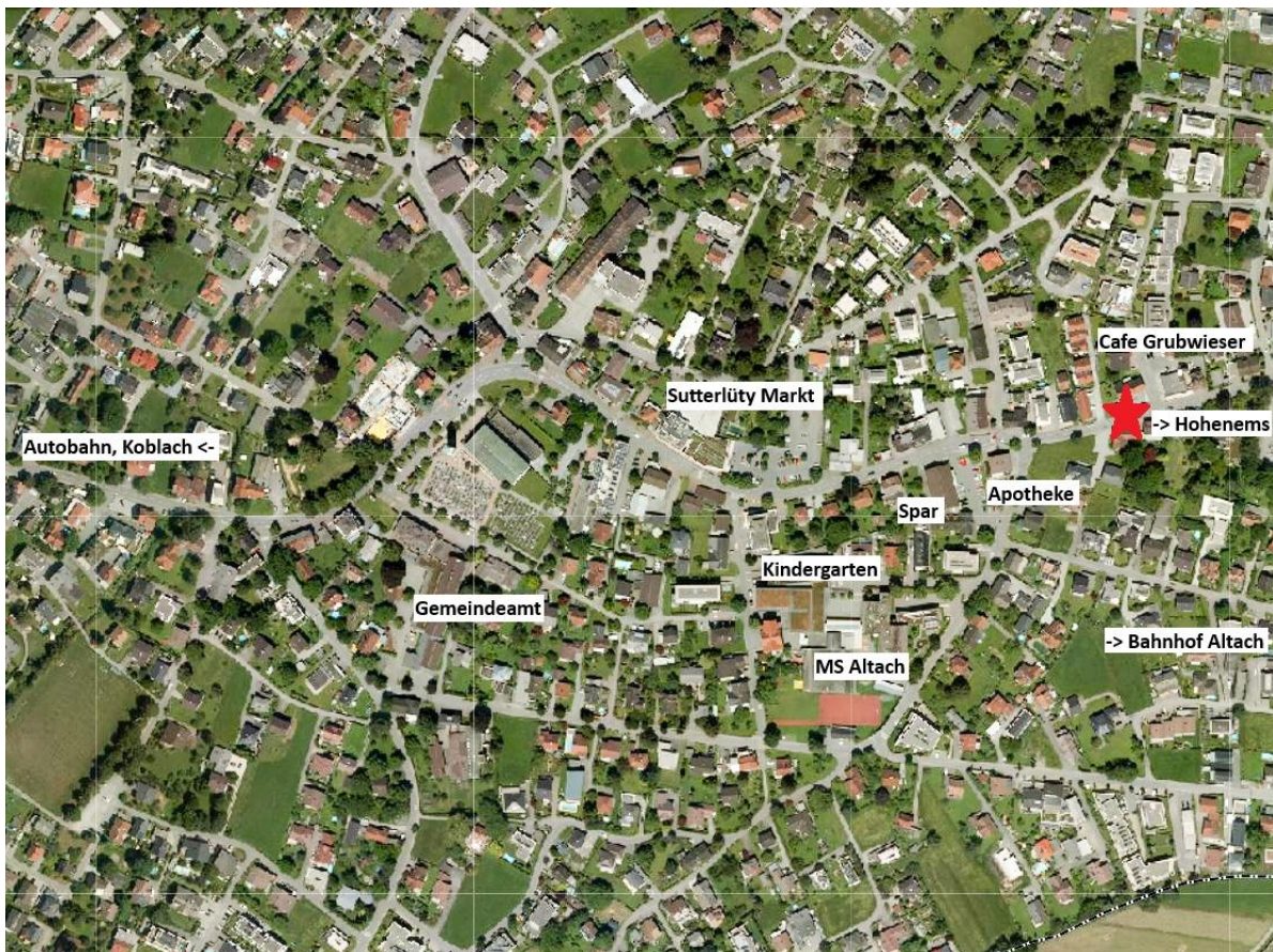
Lageplan / Anfahrt