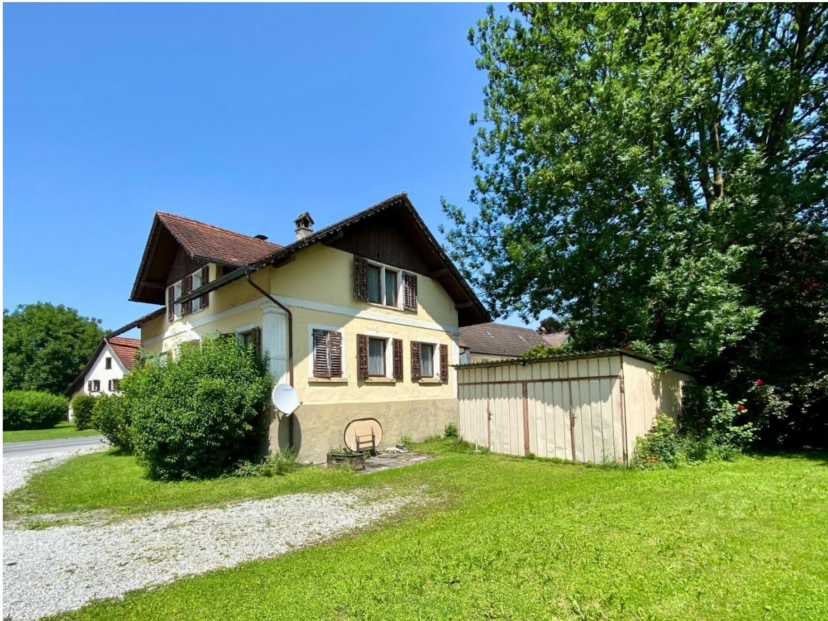
Ansicht Süd-West mit Doppelgarage