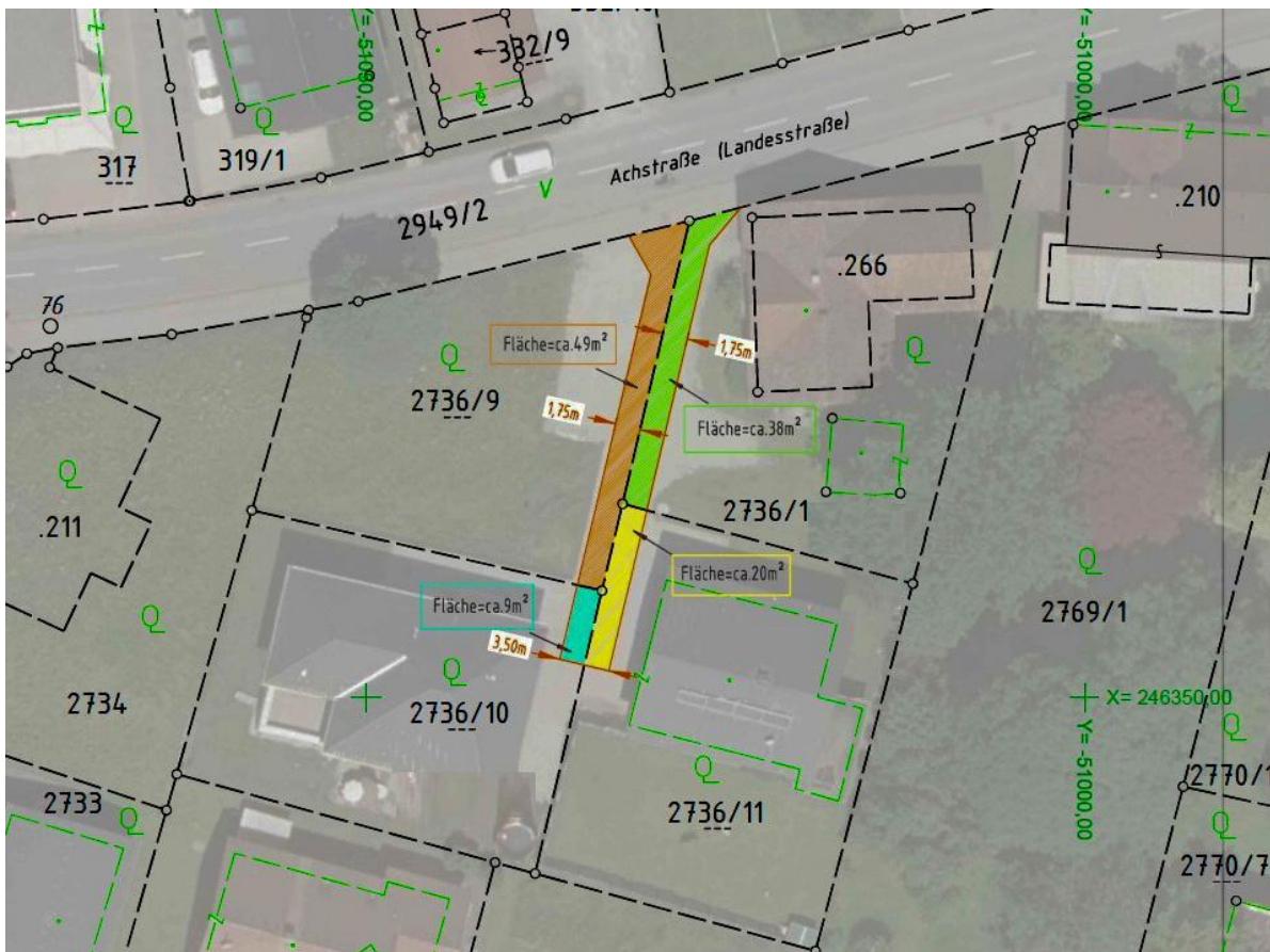
Gemeinsame Zufahrt für vier Grundstücke