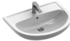
Laufen Handwaschbecken, Becken rechts od links