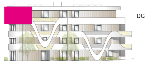
Haus E - Ansicht Nord