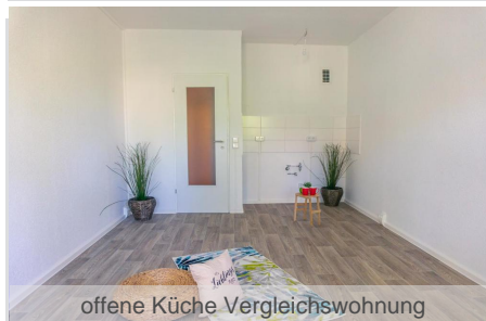
offene Küche Vergleichswohnung