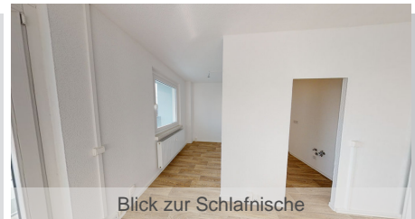
Blick zur Schlafnische