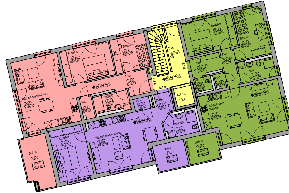
1. Obergeschoss Haus 2 Hausnummer 1b