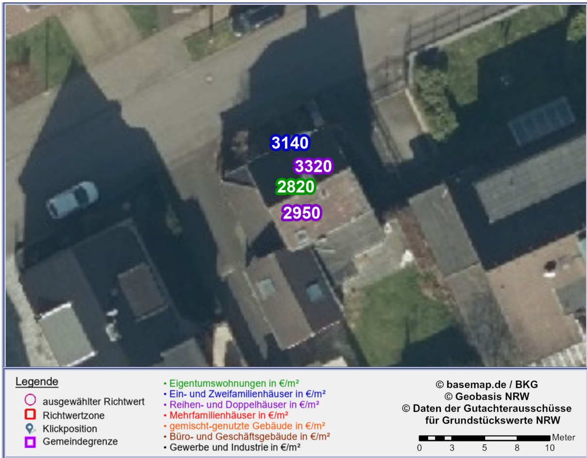
Abbildung 1: Detailkarte gemäß gewählter Ansicht