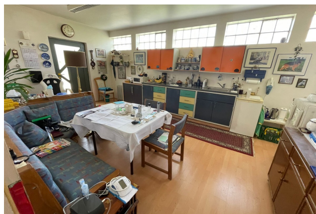
EG Laden Küche