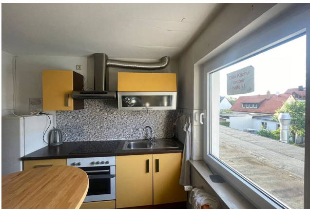
Küche 1. OG