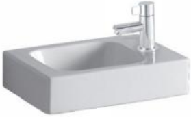
Symbolhafte Darstellung Handwaschbecken

In den WC-Räumen kommen kleine, weiße Handwaschbecken zur Ausführung.