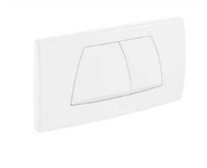
Symbolhafte Darstellung Betätigungsplatte