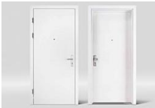
Symbolhafte Darstellung Wohnungseingangstür

Die wärmetechnischen, brandschutztechnischen und schalltechnischen Eigenschaften der Wohnungseingangstüren werden entsprechend der bauphysikalischen Vorgaben sowie nach behördlichen Auflagen ausgeführt.