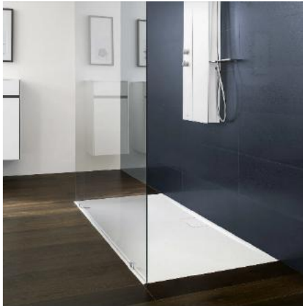
Symbolhafte Darstellung Duschtasse

Die Abmessungen können - soweit baulich möglich - auf Wunsch angepasst werden Bodenablauf, Einhandhebelmischer verchromt Aufputz, Brausegarnitur mit Handbrause, Brauseschlauch mit Wandbefestigung verchromt.