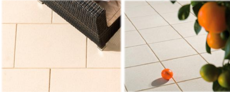
Symbolhafte Darstellung Terrassen- bzw. Balkonbelag

Die Terrassen- und Balkonböden werden mit Betonplatten ausgelegt.