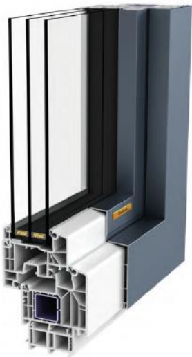
Symbolhafte Darstellung Fenster

Die Umrüstung von Einzelflügel auf Doppelflügel ist gegen Aufzahlung möglich.