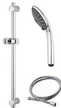
Symbolhafte Darstellung Brausegarnitur