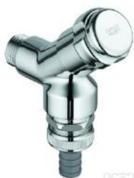
Symbolhafte Darstellung Kaltwasseranschluss

Ein entsprechender Kaltwasseranschluss mit verchromten Anschlussventil sowie einem Wandeinbausiphon für zwei Abwasseranschlüsse einer handelsüblichen Waschmaschine werden am dafür vorgesehenen Platz (lt. Wohnungsgrundrissplan) ausgeführt.