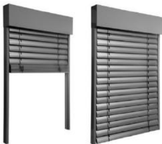
Symbolhafte Darstellung Sonnenschutz

Der Sonnenschutz liegt außenseitig und wird mit elektrisch angetriebenen Raffstores errichtet. Insektenschutzgitter sind technisch ausführbar und als Sonderwunsch gegen Aufzahlung erhältlich.