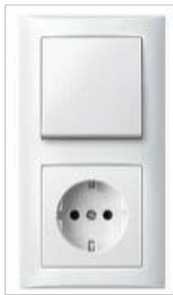
Symbolhafte Darstellung einer Steckdosen-Schalter-Kombination

Das Schalterprogramm der Wohneinheiten wird in weiß eckig ausgeführt. Die Abdeckungen sind auf Putz montiert.