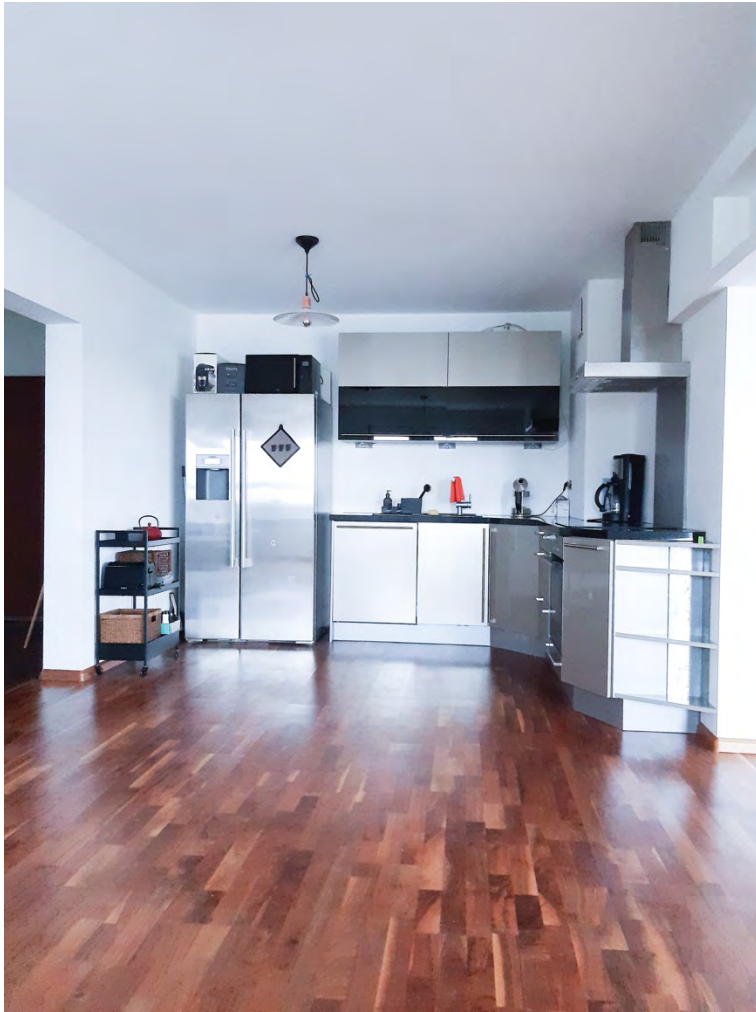
Funktionale eingerichtete Küche mit Microwelle, Kaffeemaschine, Spülmaschine und vielem mehr.