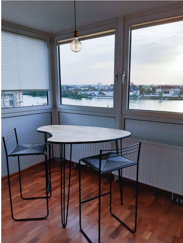
Kleine Sitzecke für eine Espressopause oder den Frühstück-Kaffee mit rundum Blick zum Rhein