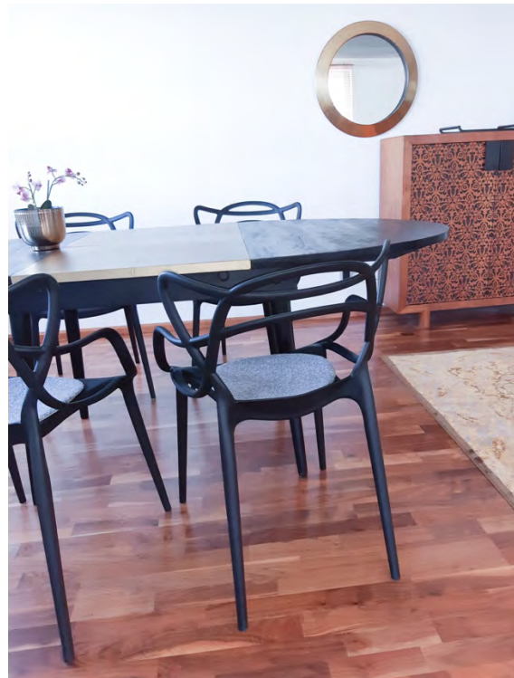
Möblierung im Design- und Vintage-Stücken