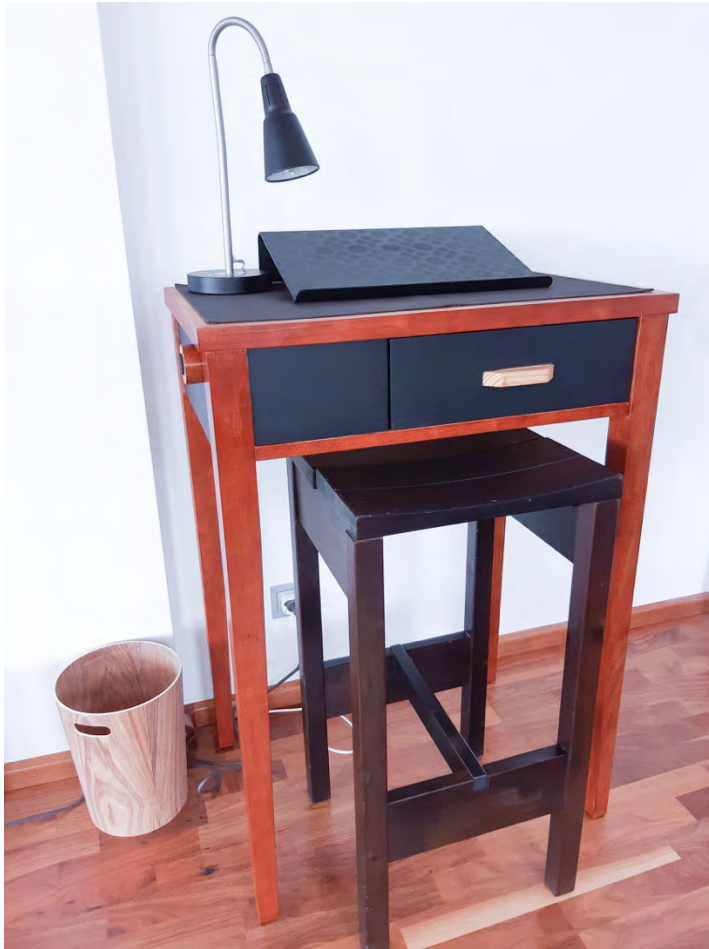
Stehpult für Homeoffice