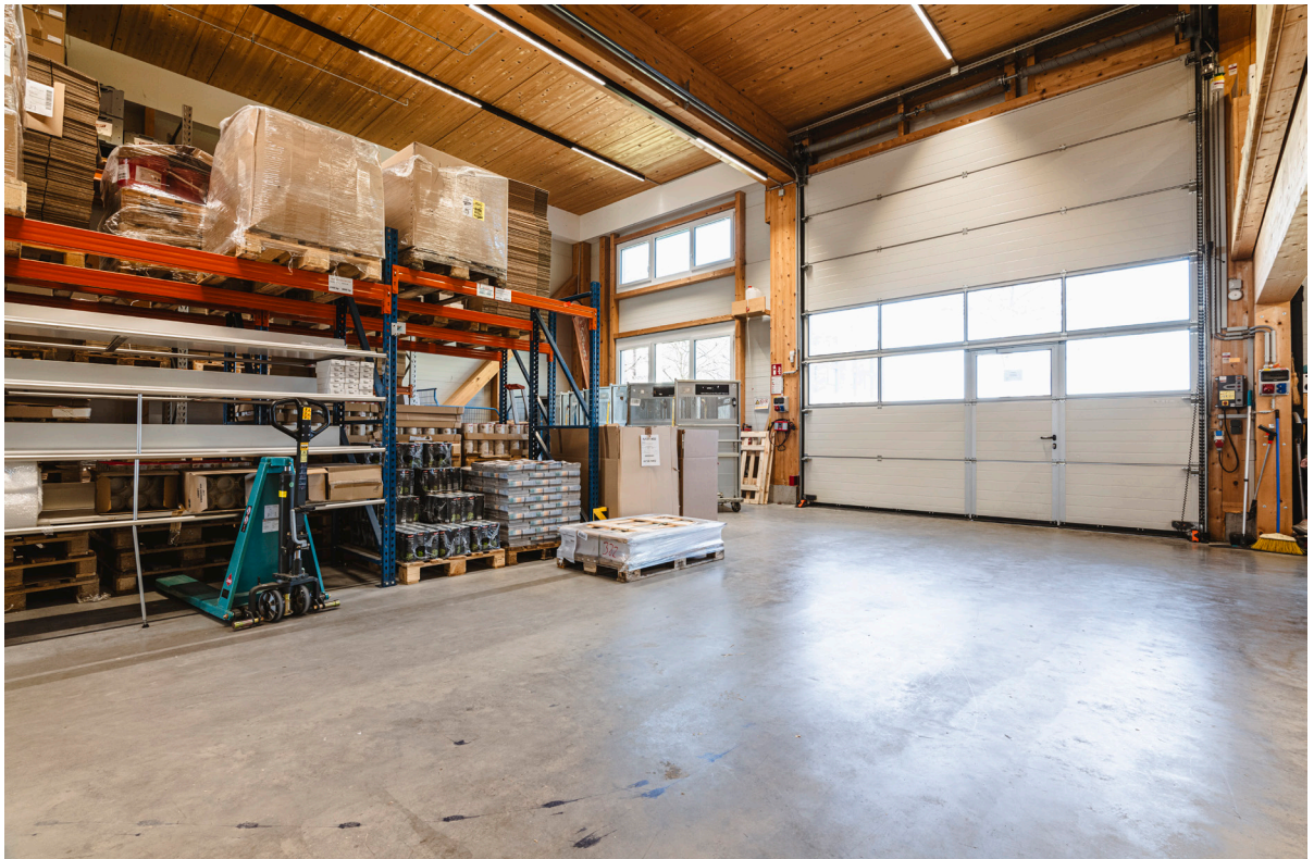
Lager / Anlieferung EG