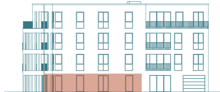
Frontansicht (Süd) - Haus 1