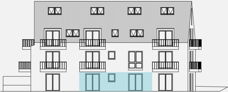
Ansicht Süden: Lage der Wohnung im Haus

Flächenermittlung auf Basis von Rohbaumaßen. Rundungsbedingte Differenzen in den Summen möglich.