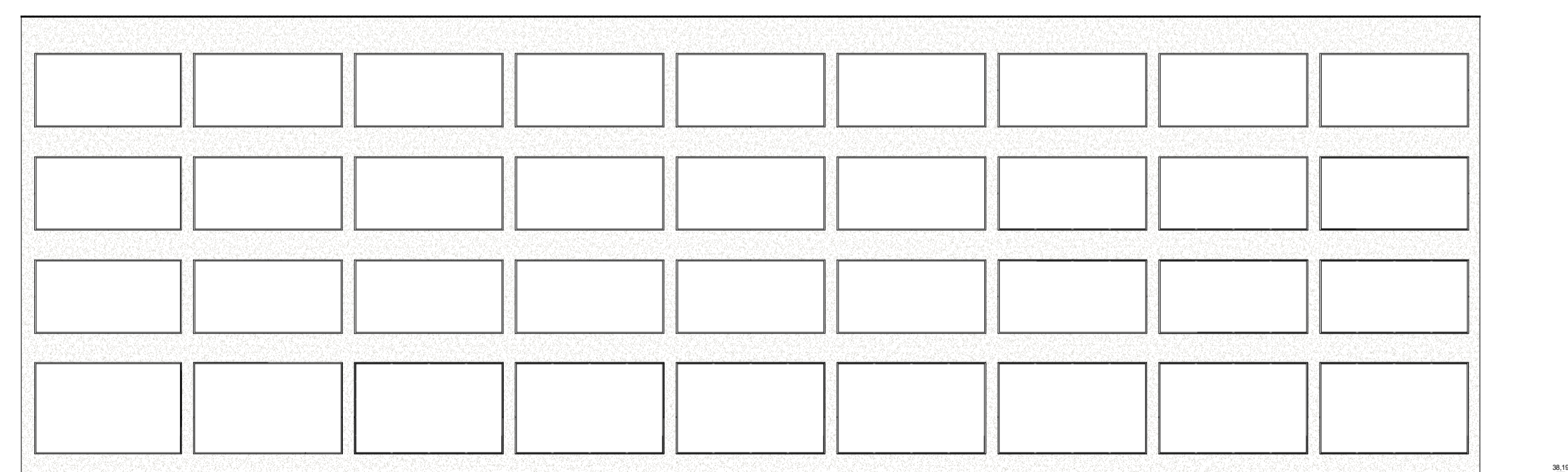
HE-Gebäude 2 Ansicht West