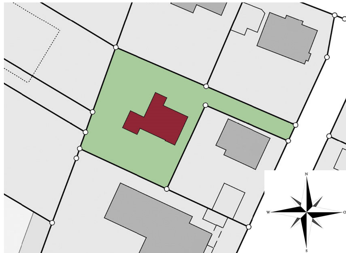
derzeitige Bebauung - Altbau Einfamilienhaus

Auch ist das Grundstück vollerschlossen. Die Fernwärme ist in der Straße ebenfalls bereits verlegt worden, so dass Sie sich bequem an diese anschließen lassen können.