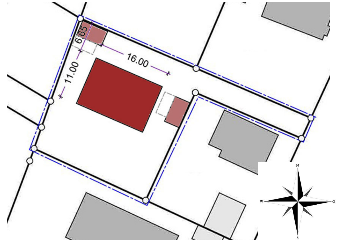
mögliche Bebauung - Doppelhaus / zwei Doppelhaushälften mit 2 Garagen

Für weitere Informationen wenden Sie sich bitte direkt an uns. Bitte beachten Sie auch, dass die oben genannten Möglichkeiten einer Bebauung nochmals detailliert mit der Gemeinde Oberhaching für die tatsächliche Realisierung besprochen werden müssen.