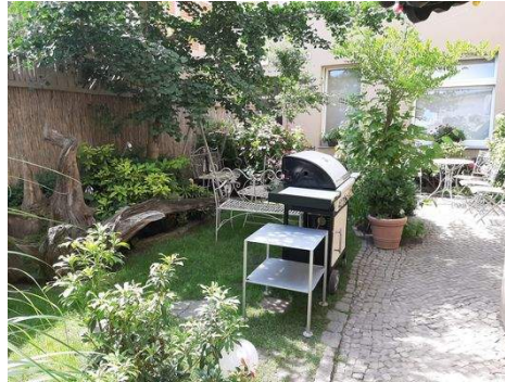
Teil vom Garten