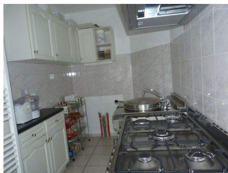
Cateringküche mit Gasherd