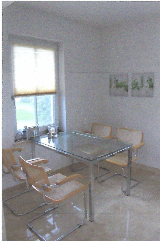
Esstisch in der Küche