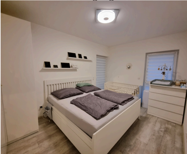
Schlafzimmer mit Zugang zum Balkon