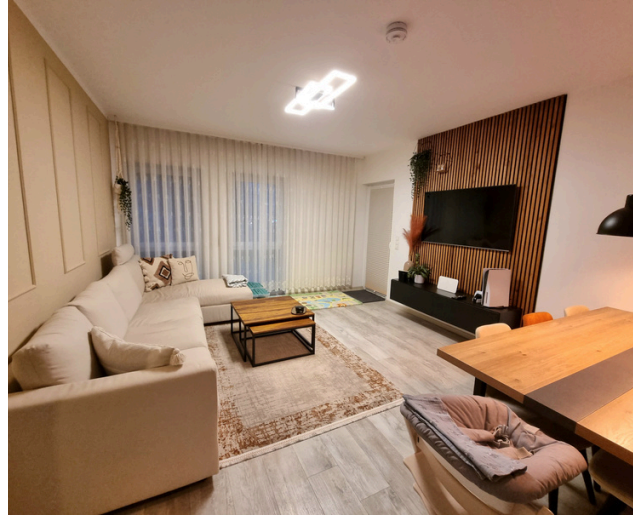
Wohnzimmer mit Zugang zum Balkon