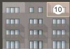
HAUS TROMBA 6.3