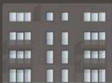
HAUS FAGATTO 6.2