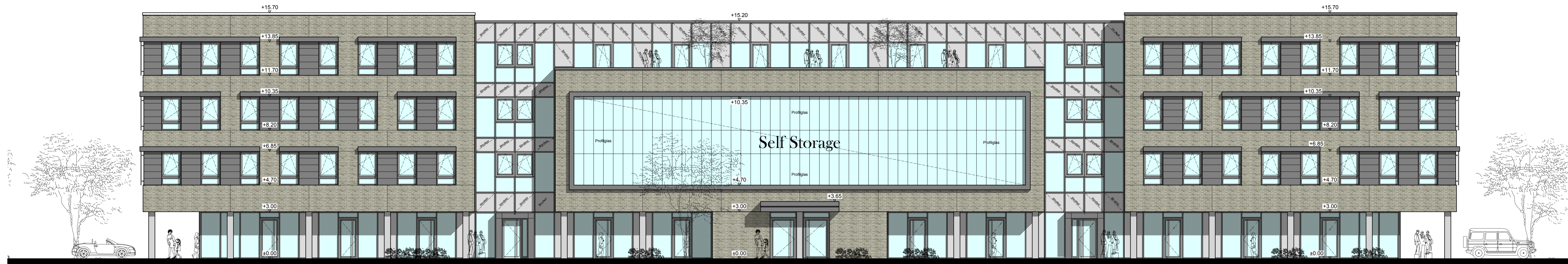
- ANSICHT ACHSE 5 -