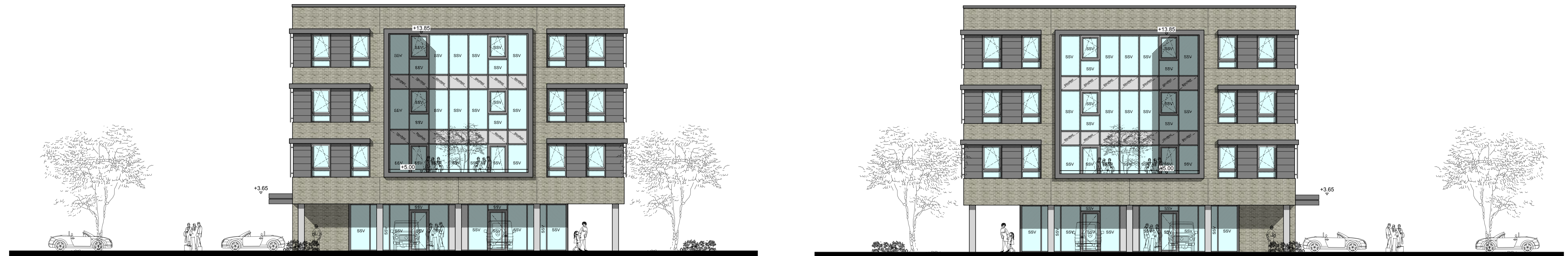
- ANSICHT ACHSE A -