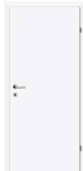
weiß matt Drücker Edelstahl