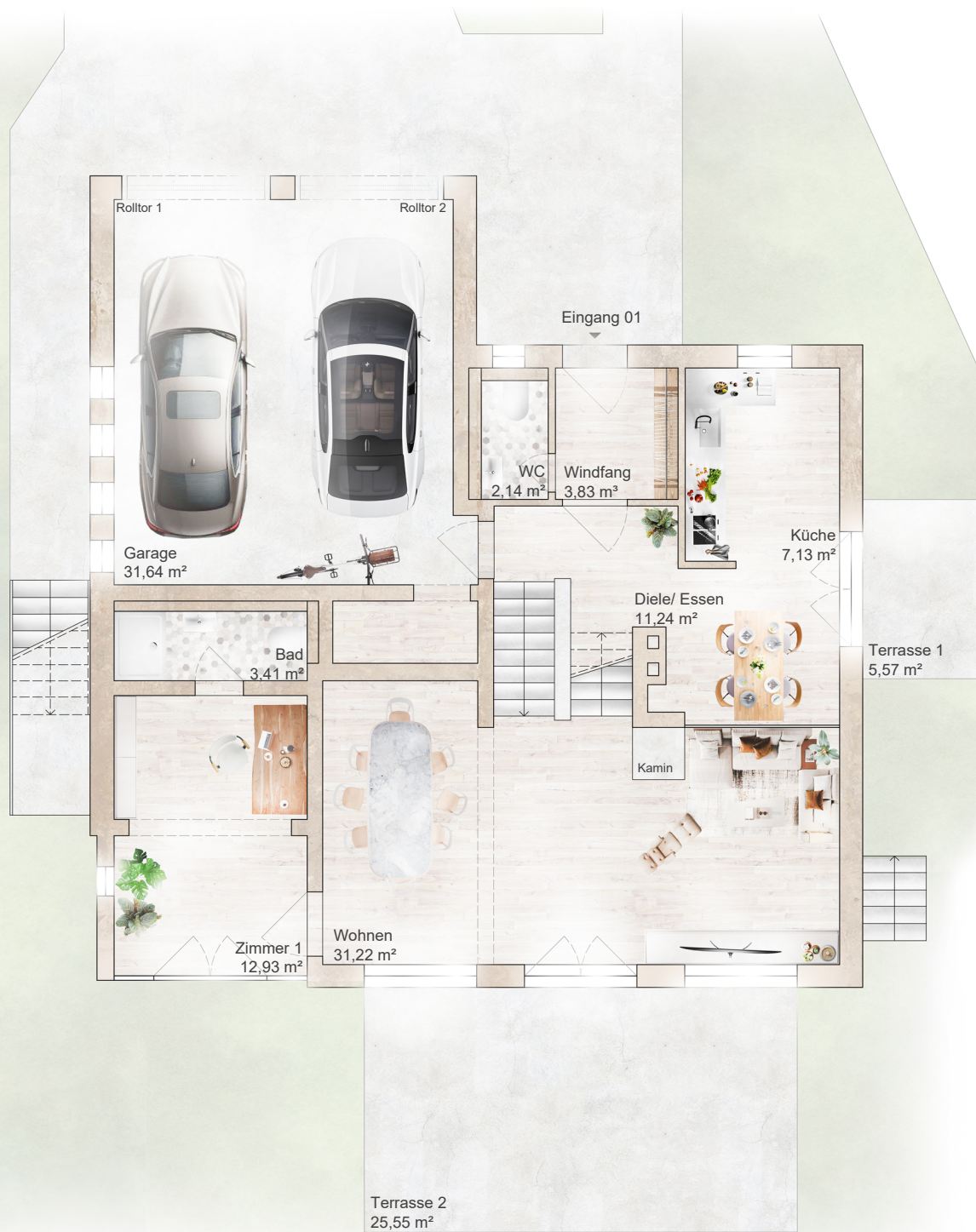
Grundriss M 1:100