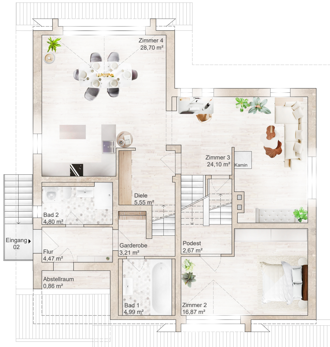
Grundriss M 1:100